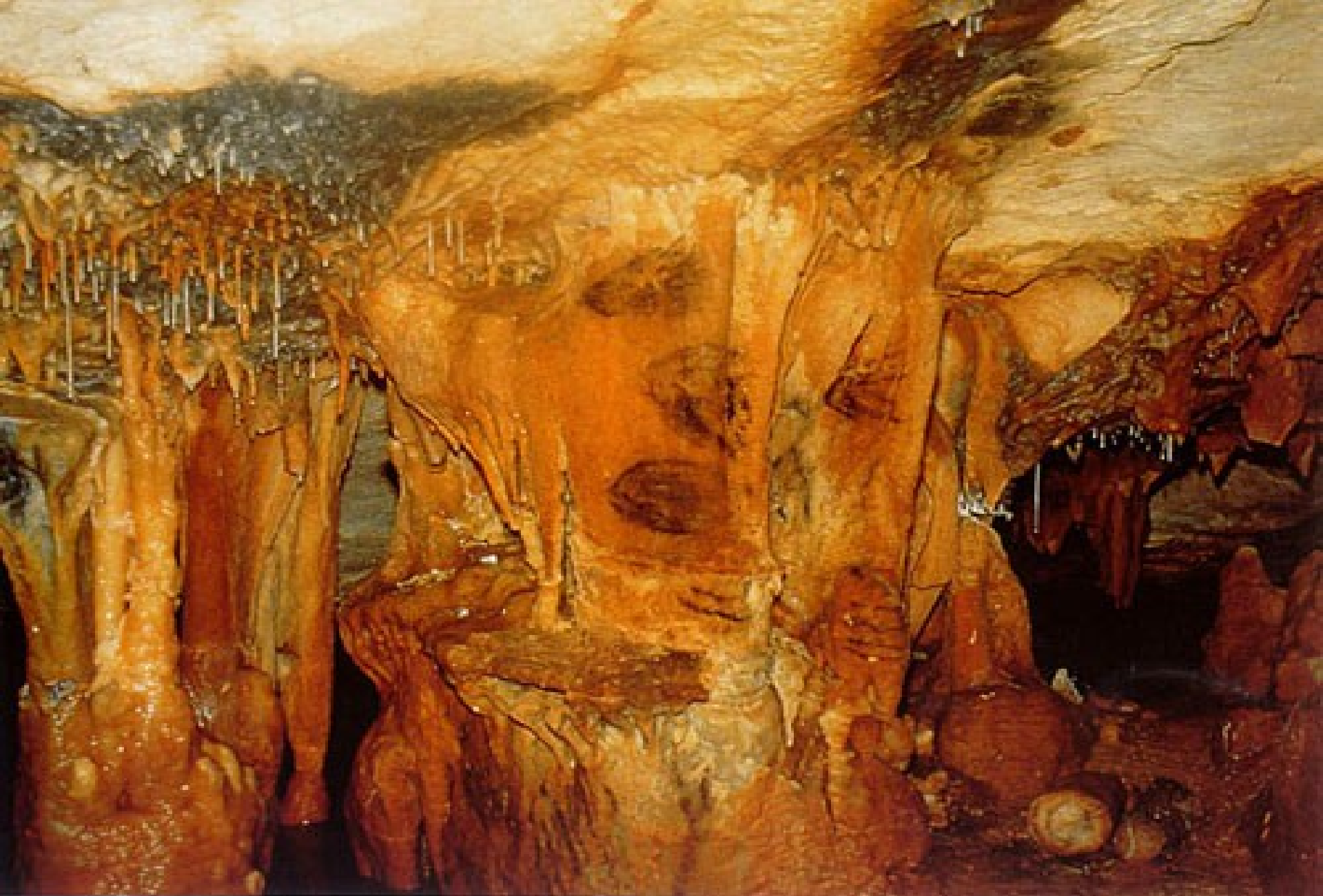
Zone sud ouest. Dessins noirs évoquant la forme de méduses