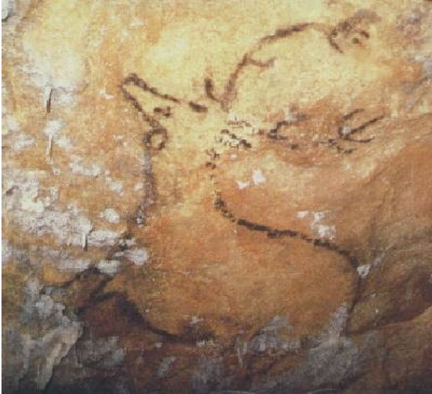
Cerf peint au charbon de bois et partiellement recouvert de calcite