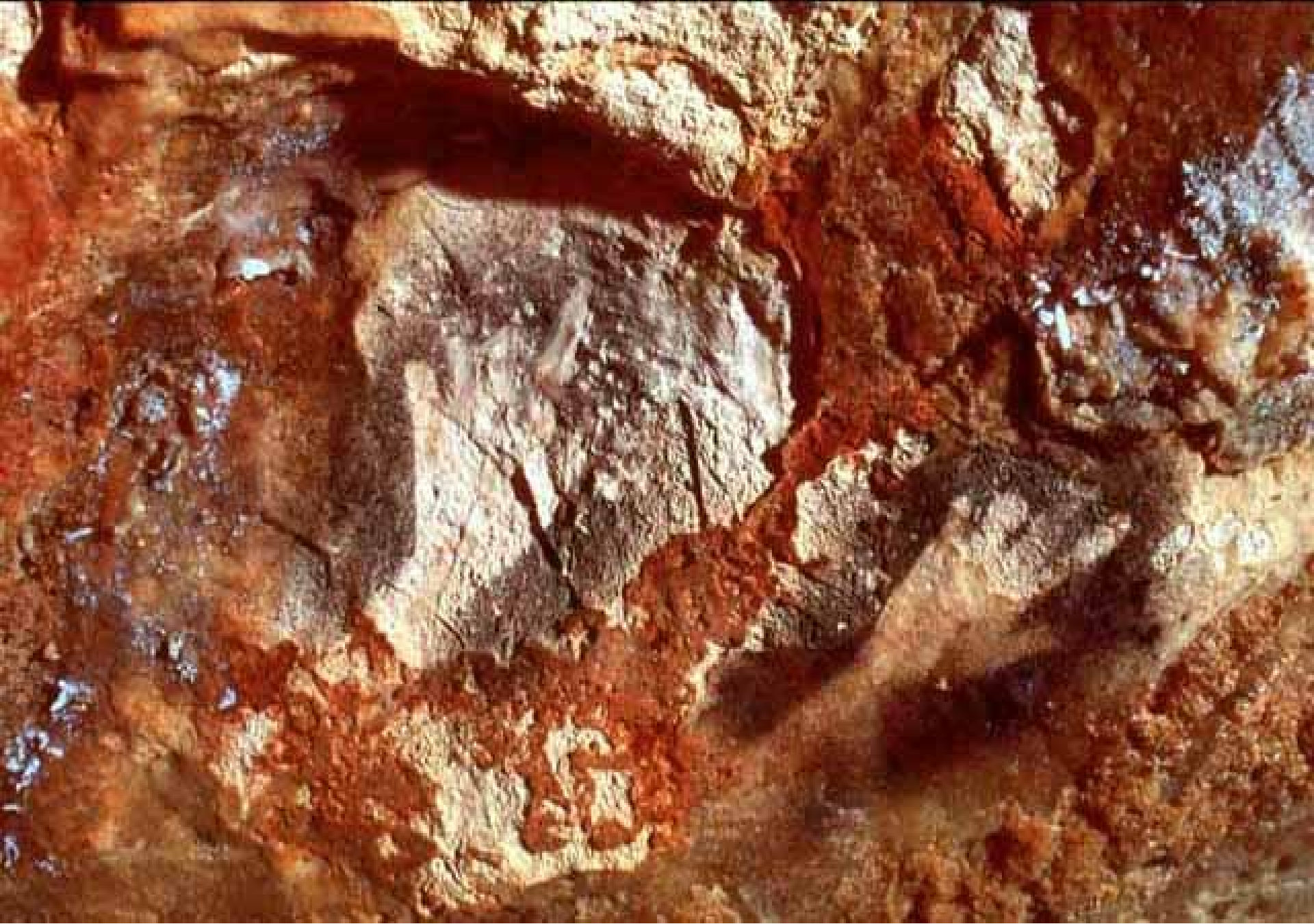
Mains négatives à doigts incomplets près du Grand Puits