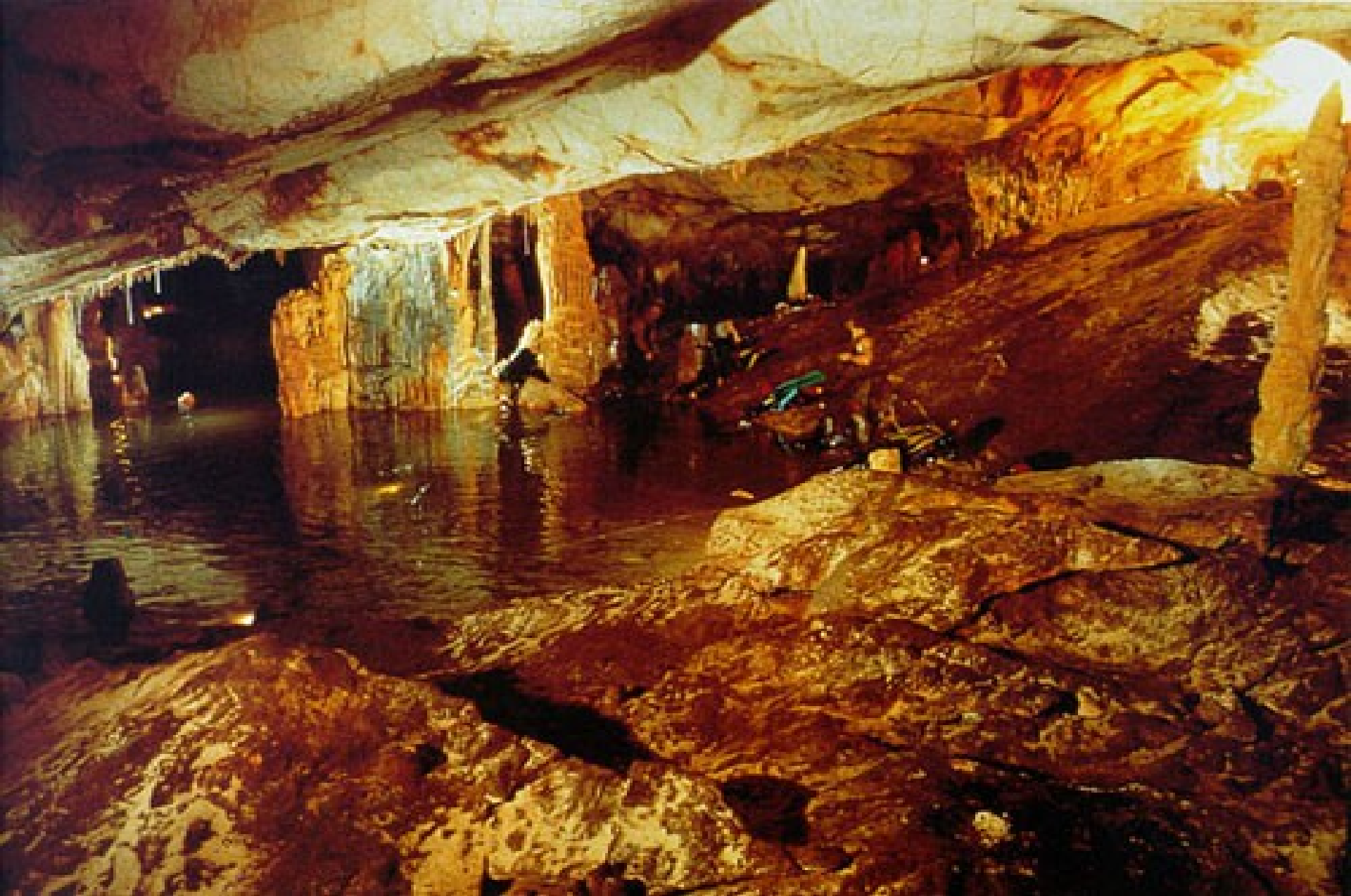
Grande salle émergée - vue prise de l'est. On distingue à droite « la plage », plan incliné

recouvert de coulées de calcite. La colonie sous-marine d'espèce est située à