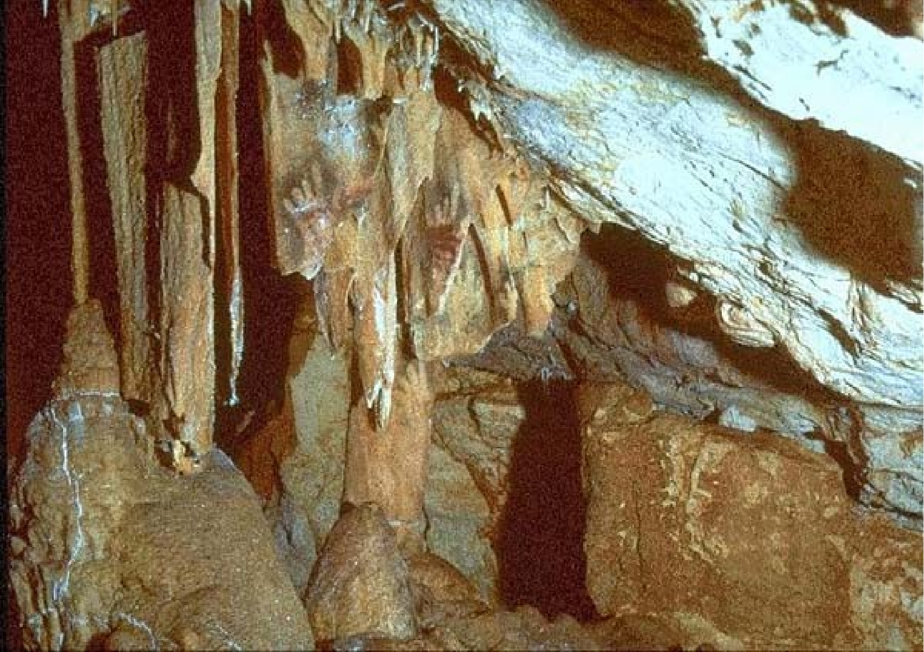
Série de mains négatives sur fond noir