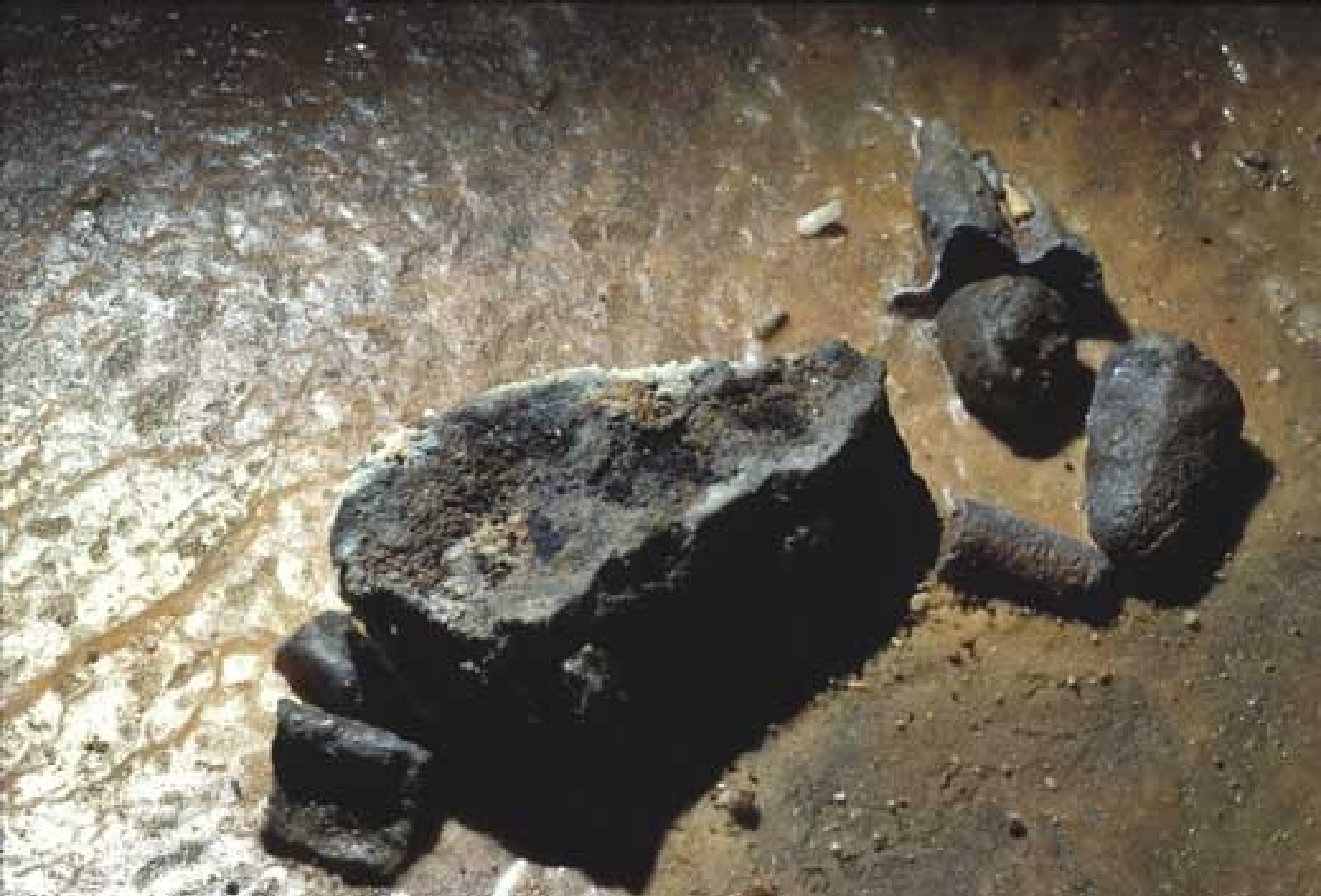
Bloc rocheux couvert de charbons