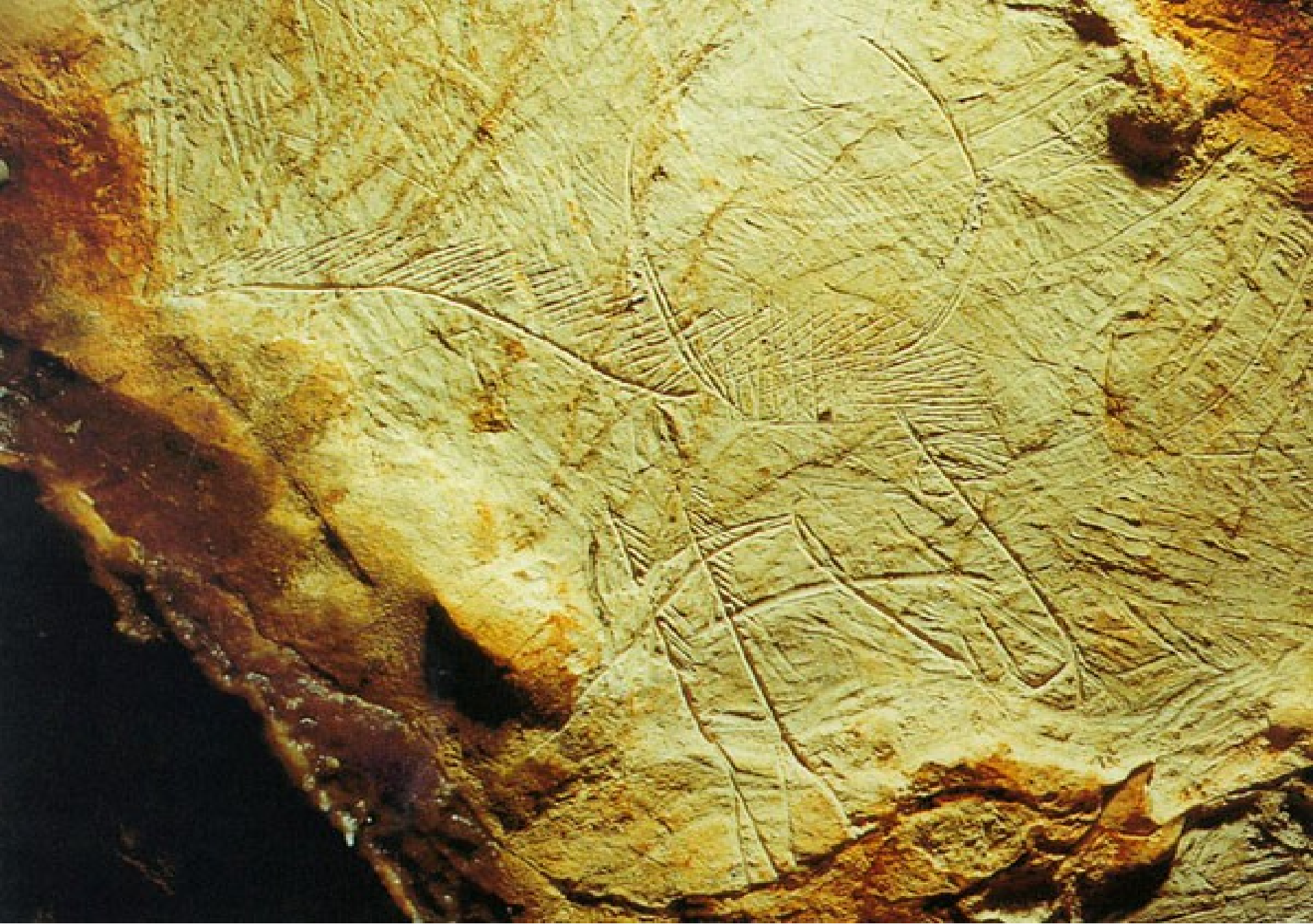
Zone sud ouest - animal