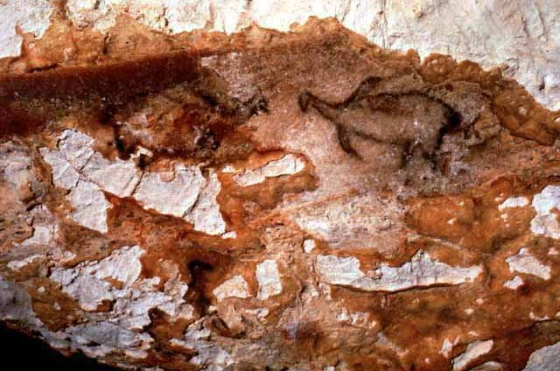
Pingouins ; 27 et 26 cm ( 18 500 ans avant le présent) Ils sont peints sur une voûte à 1,80m du sol.