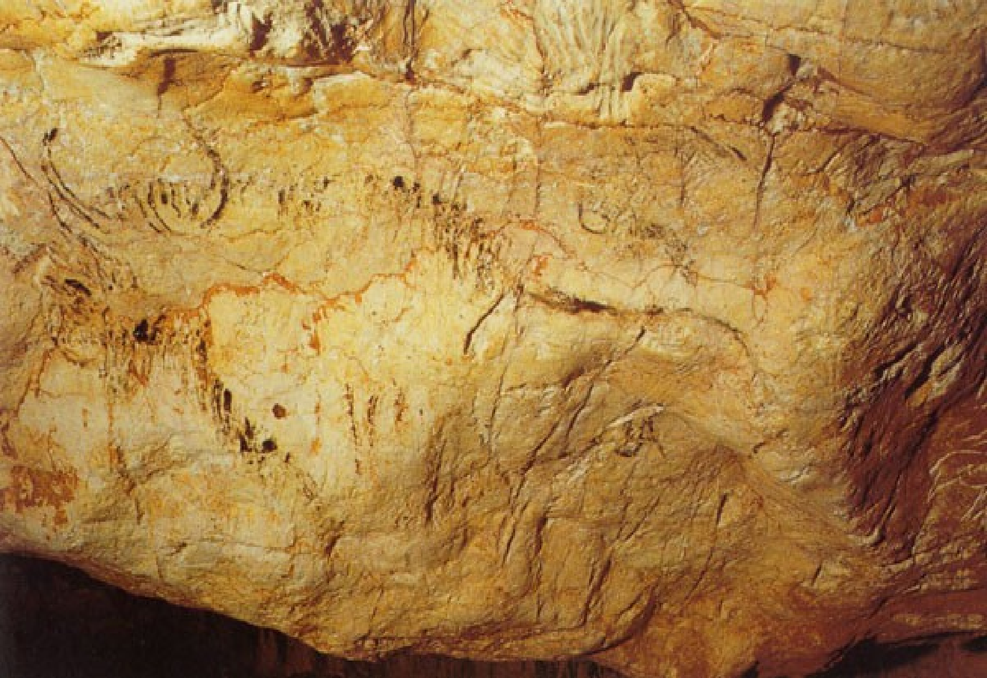
Grande salle paroi EST : Bison - 27 350 ans avant le