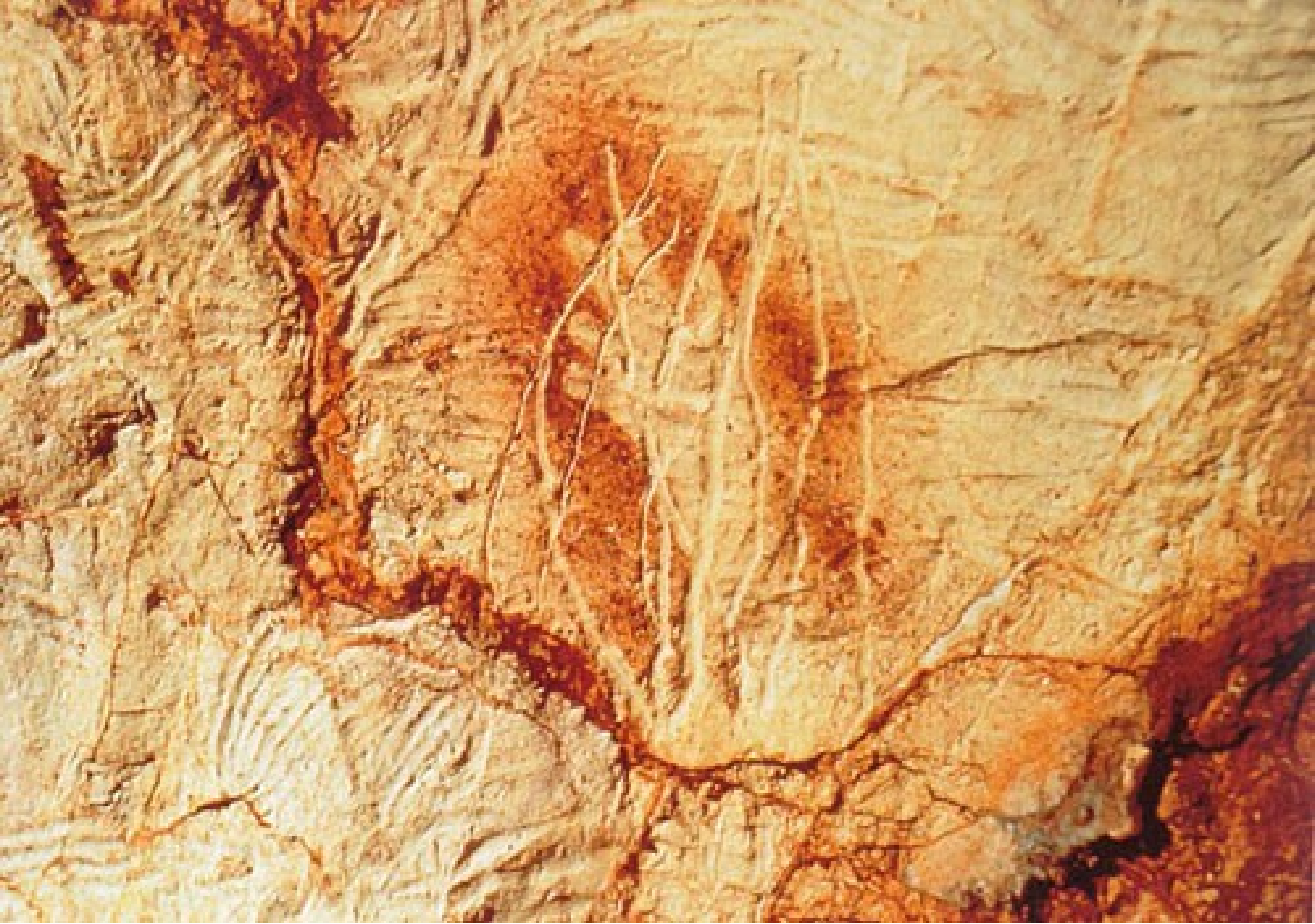
Grande salle paroi est - panneau des mains rouges - 27 000 ans avant le présent