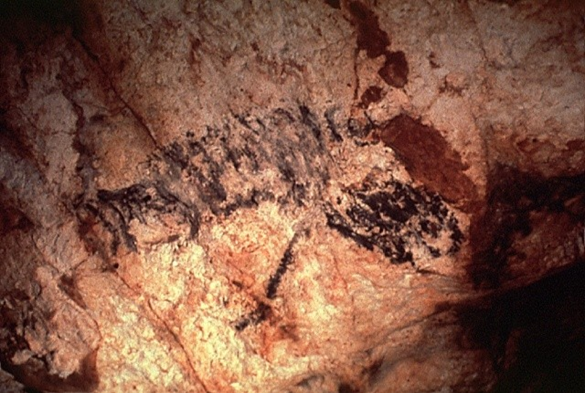
Cheval noir réduit au protomé ; zone est de la grande salle : 18 500 ans avant le présent