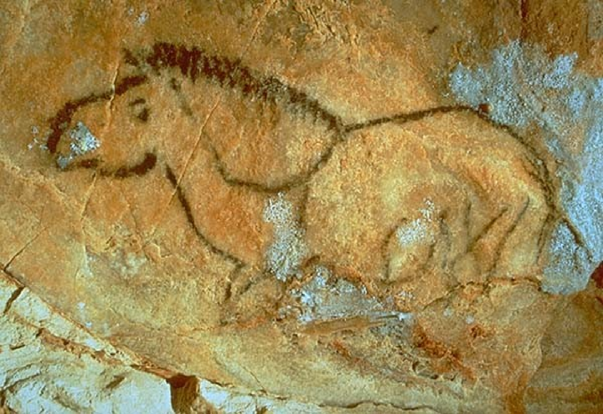
Salle basse de la zone ouest - cheval pansu peint en noir - 18 500 ans avant le présent