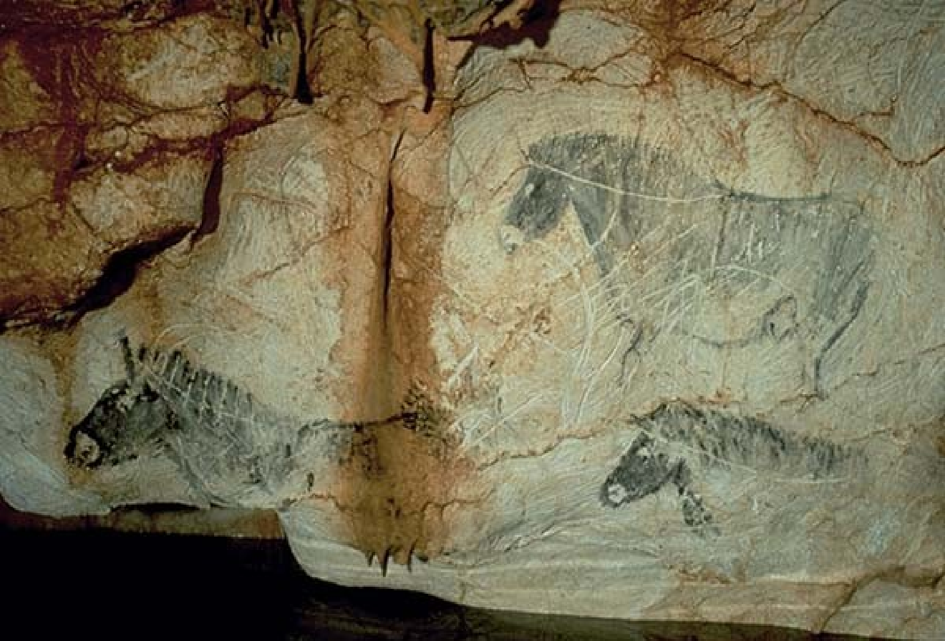
Zone sud-ouest - panneau des chevaux - 18 820 ( \pm 300 ans) avant le présent