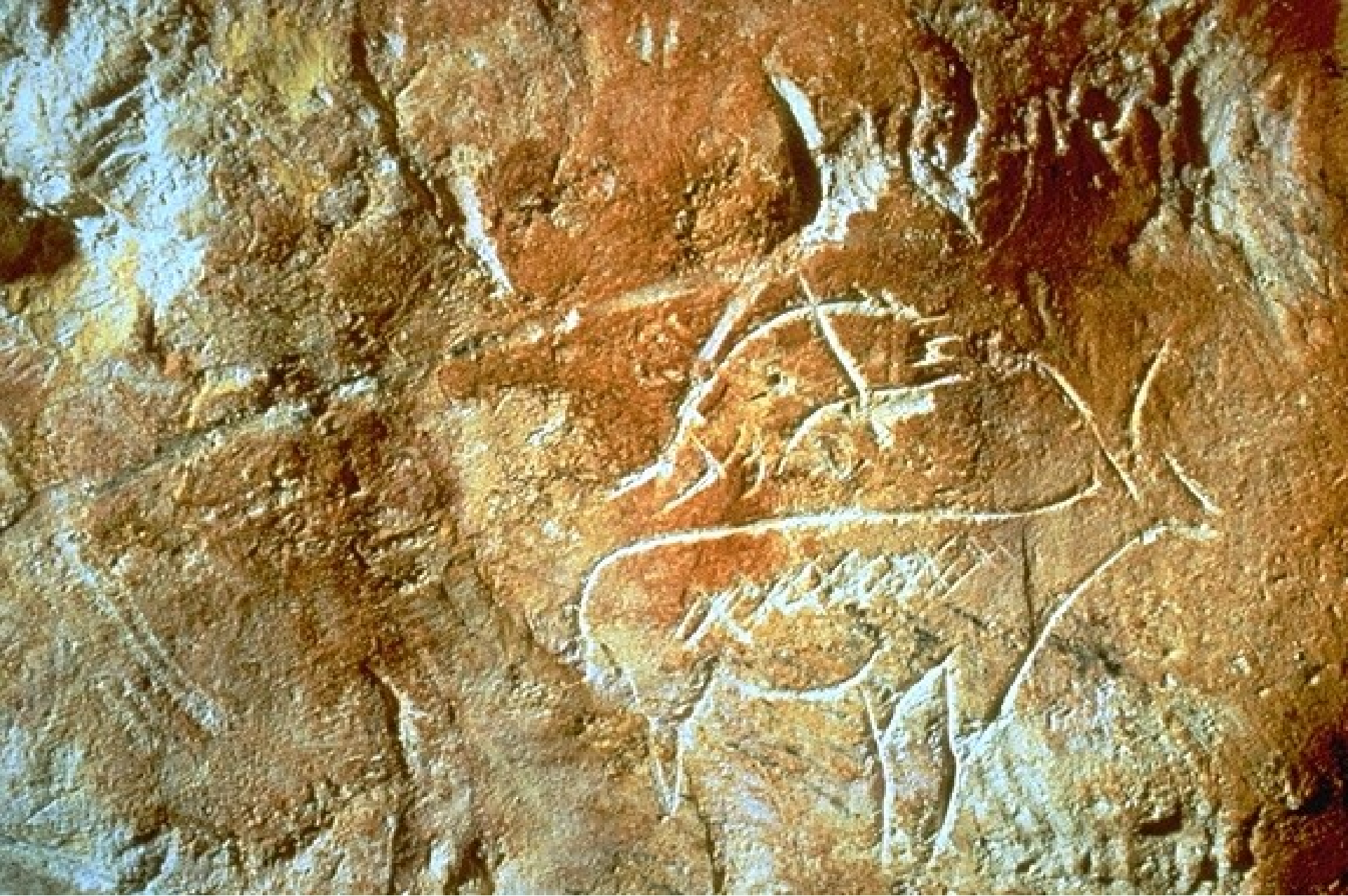
Sur la faille est, petit bouquetin gravé associé à de nombreux raclages