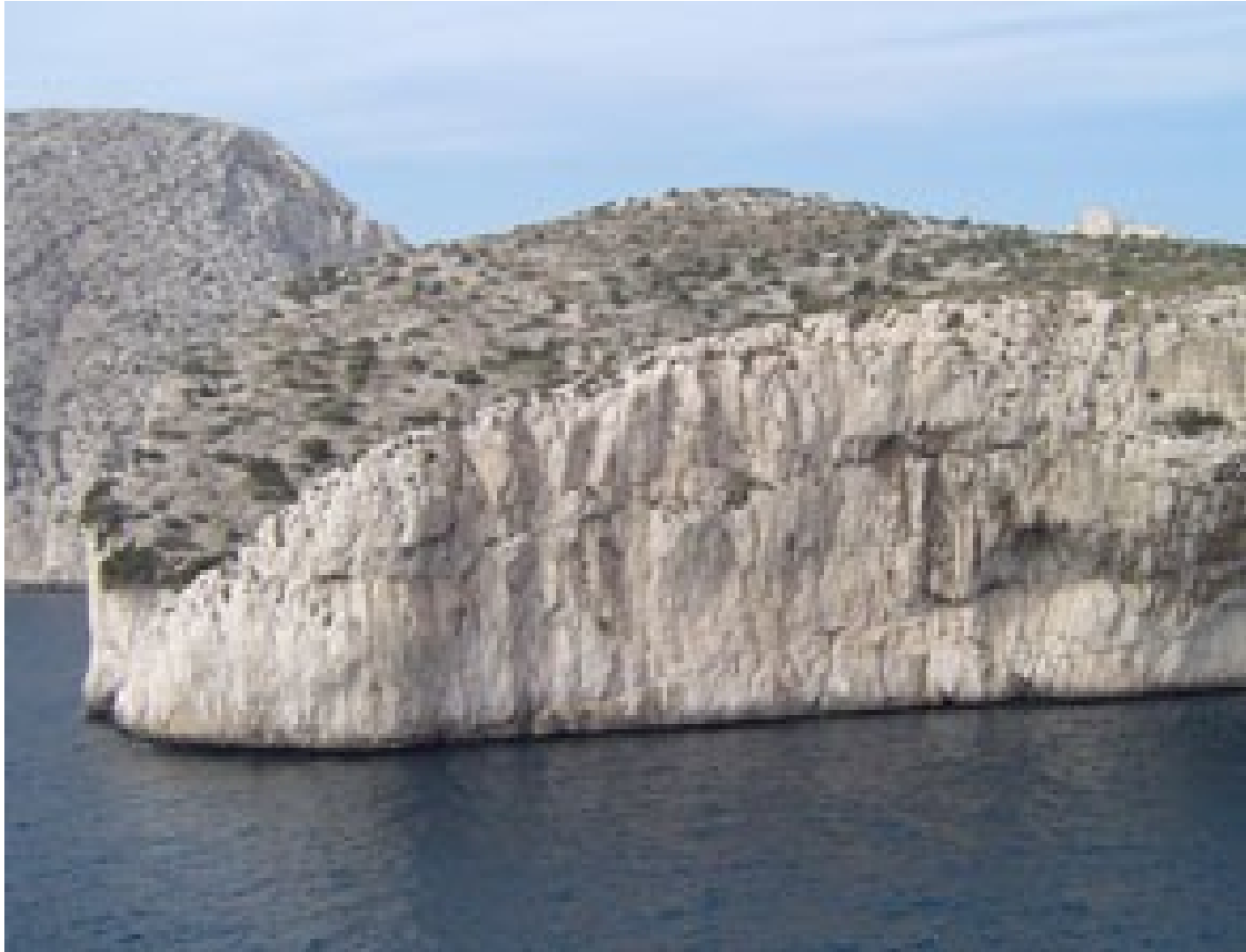
Falaise dominant l'entrée sous-marine de la grotte COSQUER