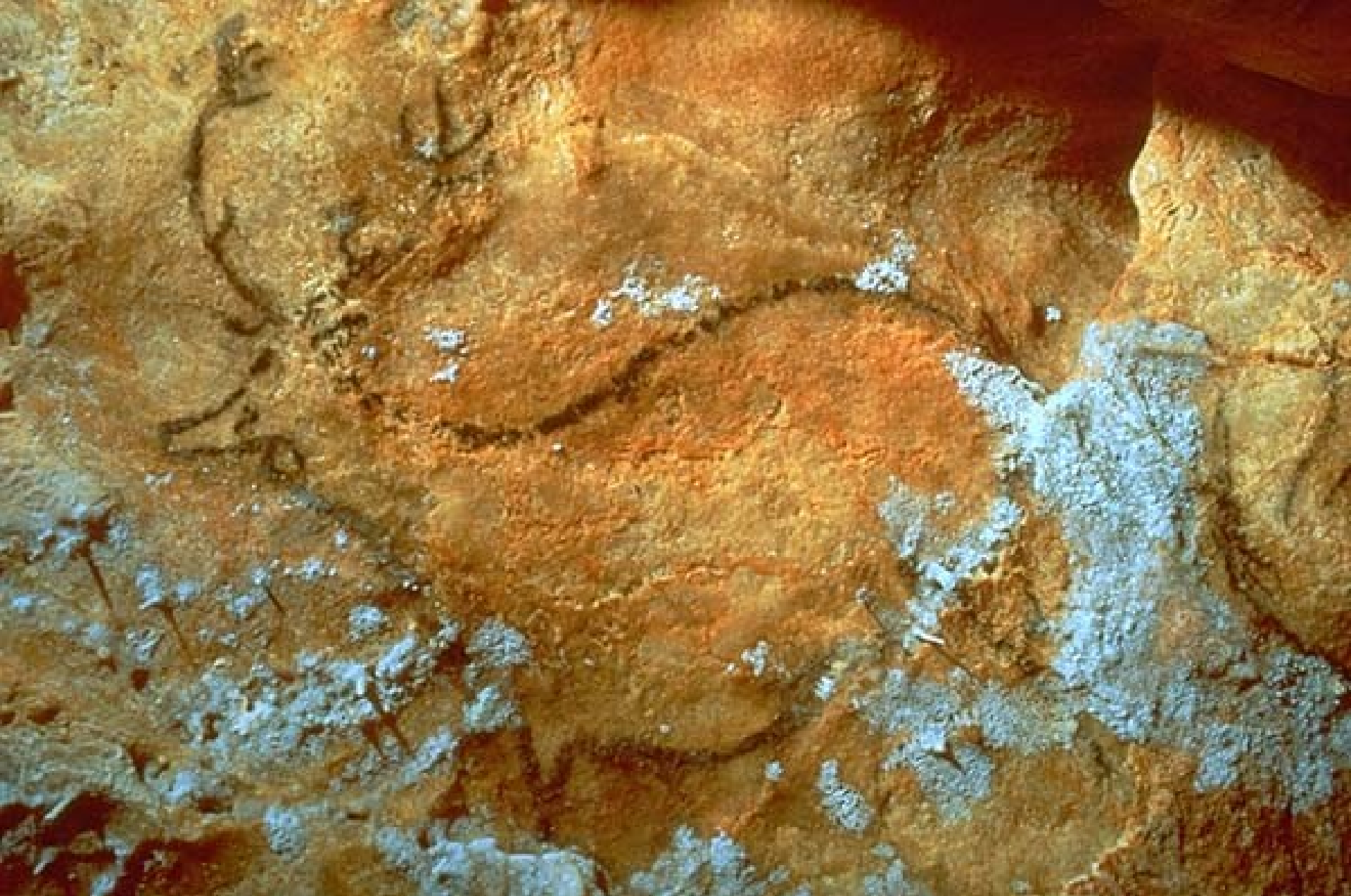
Cerf peint en noir sur un plafond bas, salle basse de la zone ouest 18 500 ans avant le présent