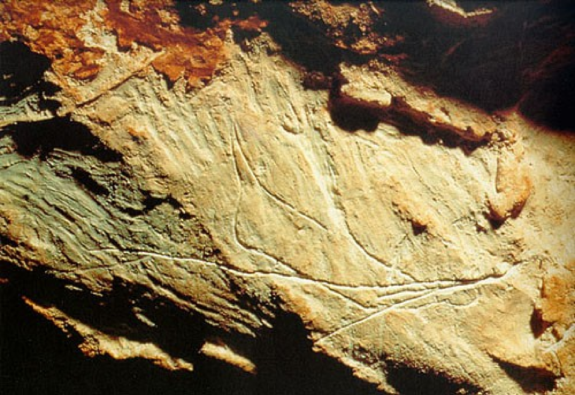
Grande salle partie Est, retombée de voûte -